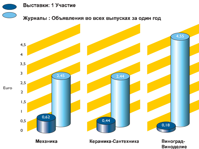
Таб. с/2- Стоимость (место + содержание) потенциального контакта для выставок и журналов (один выпуск) в различных отраслях